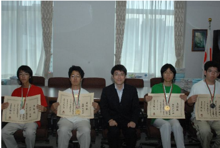
記念撮影（文部科学省にて）